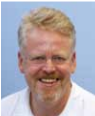
Homöopathie-Stiftung des Deutschen Zentralvereins homöopathischer Ärzte (DZVhÄ)

mit der Arbeit geht es manchmal wie mit dem Frühling: Eine Weile lang sieht es so aus, als ob scheinbar nichts passiert. Dann aber werden die ersten Blüten sichtbar und neue Pflanzen schlagen Wurzeln. Und so freue ich mich, dass mit der Jahrestagung des DZVhÄ 2015 in Köthen erste Ergebnisse und neue Forschungsprojekte zur Homöopathie vorgestellt werden. Sie werden mit großem Engagement der Wissenschaftler vorangebracht und durch die Homöopathie-Stiftung gefördert. Möglich wurde dies durch die Spenden der homöopathischen Ärztinnen und Ärzte – Ihnen allen meinen herzlichen Dank! In diesem Newsletter und erstmals bei dieser Jahrestagung werden geförderte Projekte vorgestellt. Wir freuen uns auf Ihren Besuch bei der Projektpräsentation am Donnerstag, den 14.5.2015 ab 16.30 Uhr im Anna-Magdalena-Bach-Saal.